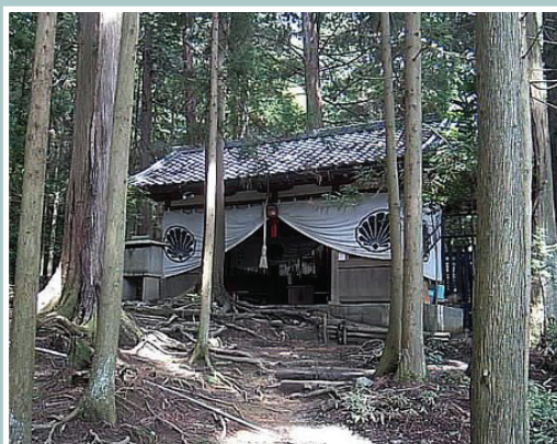
Skats uz pagodu Kurama kalnā, kur parādījās Jaunava Marija

kārt visai teritorijai. Vēl nav satumsis. Sveicināju šīs vietas garus un lūdzu aizstāvību. Pēc tam apstājās pagodas priekšā trijstūri veidojošu koku saknēs un sāku skaitīt: „Mūsu Tēvs debesīs...”, „Gate, gate, ara gate...”, „Kungs, Jēzu Kristu, Dieva Dēls, apžēlojies par mani...”, reiki ceturtais simbols. To visu dziedāju – te skaļi, te klusāk, ļoti ātri satumsa. Debesīs vīdēja Mēness. Ir pilnmēness laiks. Sajutu – tūlīt pulkstenis būs 19.00. Paskatījos pulksteni: 18.58, ir laiks.