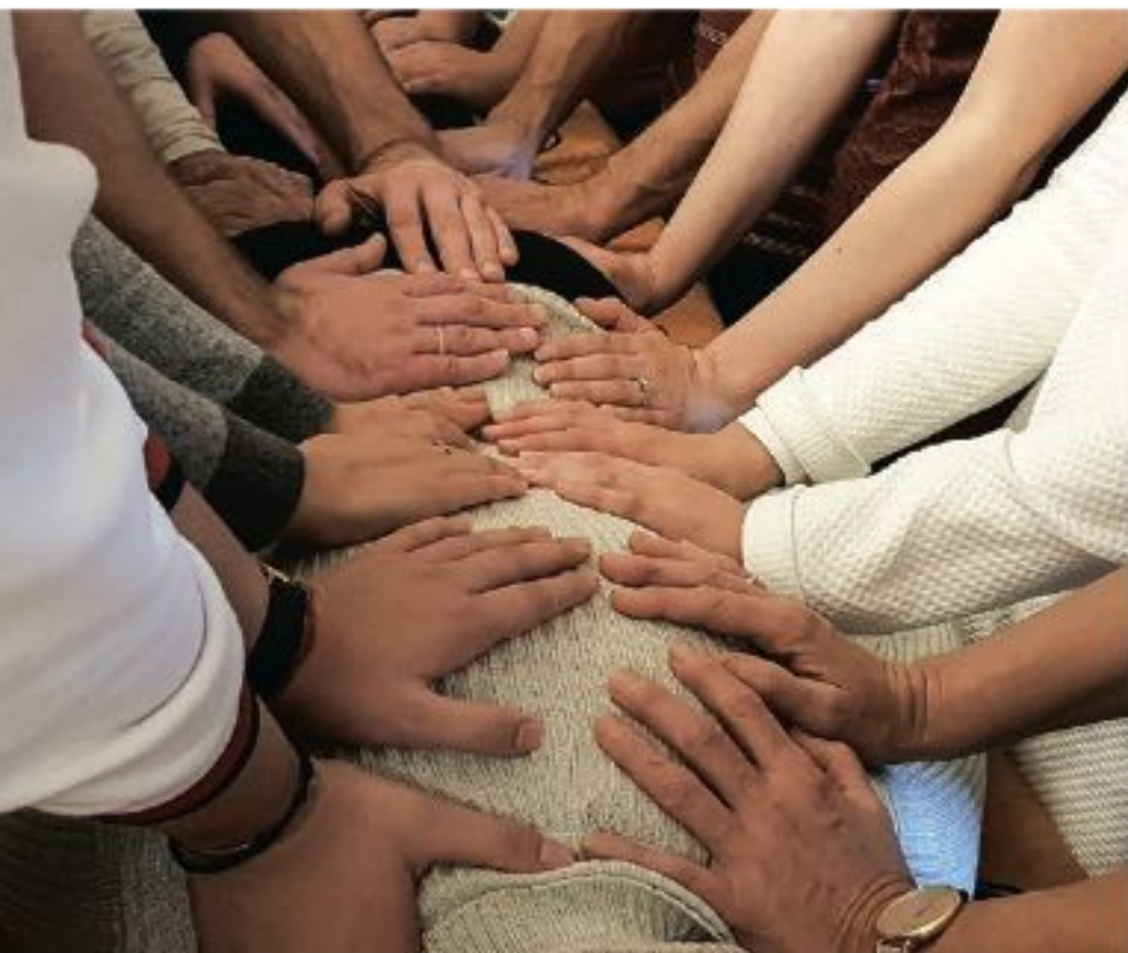
◀ Klusēšanas retrīts. 2010. gads.