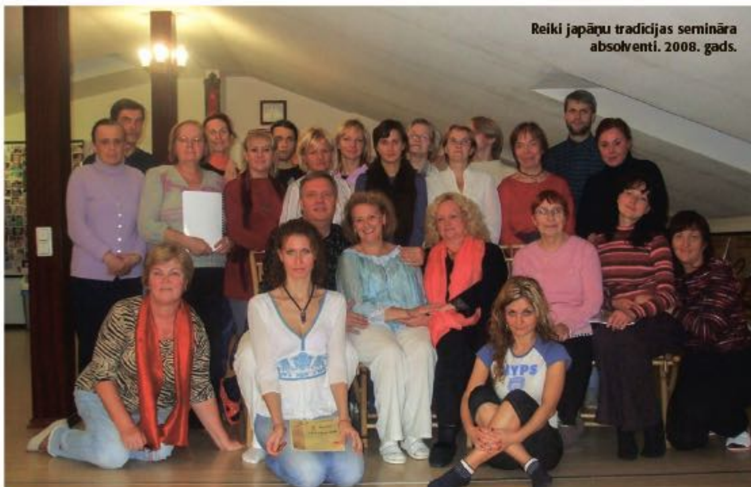
Reiki japāņu tradīcijas semināra absolventi. 2008. gads.

Pēc tam cilvēki stāsta, ko šajā brīdī redzējuši vai jutuši. Viņi bieži redz Jēzu vai Dievmāti, mūkus vai lamas, enģeļus – visu to, kas mājo mūsu garīgajā pasaulē un ir zināms cilvēcei. Šī iniciācija ir noskaņošana noteiktai svārstību