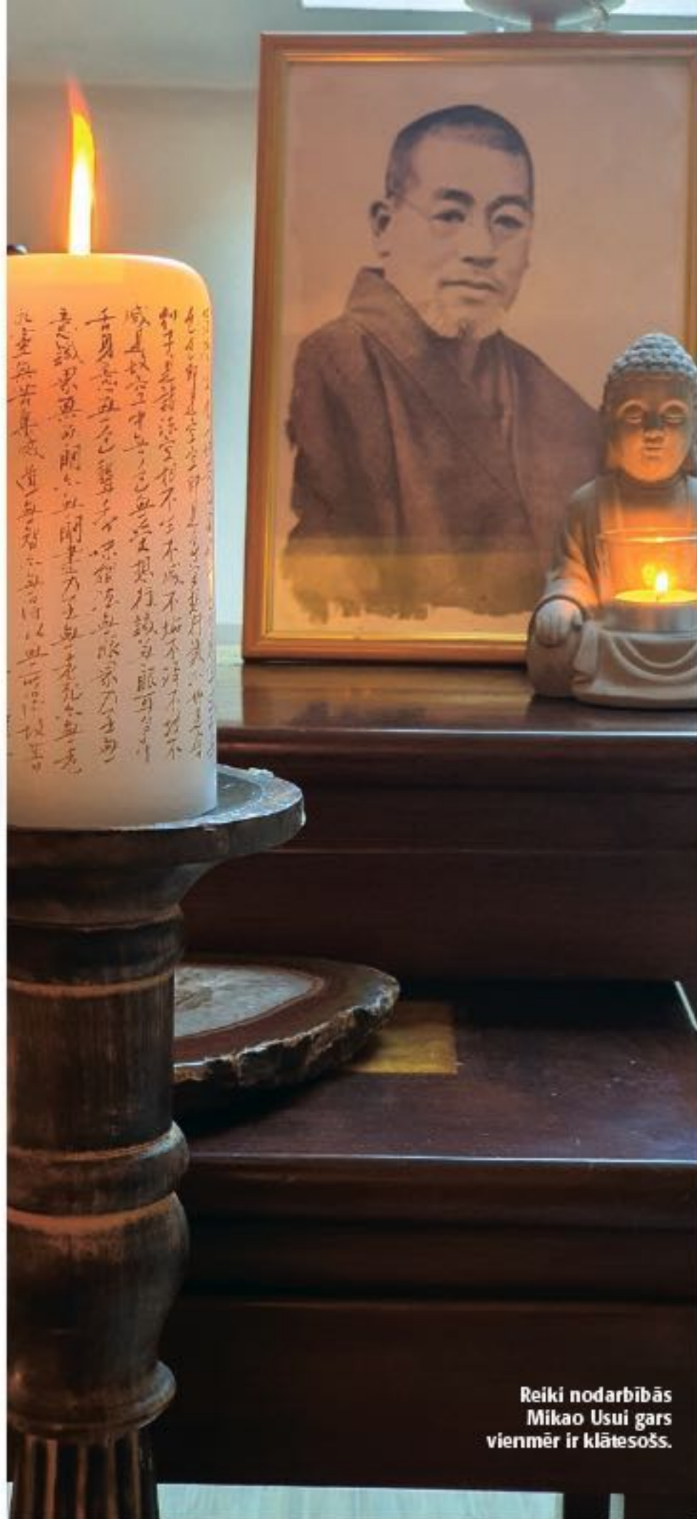
Reiki nodarbībās Mikao Usui gars vienmēr ir klātesošs.

Otra manis radīta metode ir antitigrēnas masāža. Manai mīļotajai